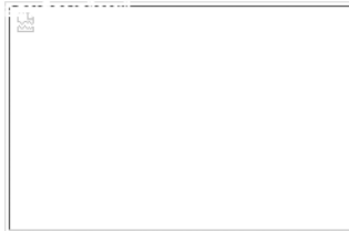
ปชมท.ขอเชิญชวนส่งผลงานคัดเลือก บุคลากรดีเด่น ประจำปี 2558 (download ประกาศ แบบเสนอชื่อ คลิกเลย)

ขอเชิญร่วมงานมหกรรมแสดงผลงานด้านสร้างสรรค์นวัตกรรม สิ่งประดิษฐ์ และการพัฒนา งานประจำ ของบุคลากรสายสนับสนุนในสถาบันอุดมศึกษา ครั้งที่ 1 และค่ายฝึกอบรมการ