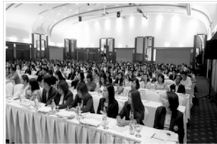
การประชุมวิชาการเครือข่ายพัฒนาระบบงาน บริหารและธุรการ ครั้งที่ 4