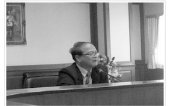
รองอธิการบดี มหาวิทยาลัยรามคำแหง กล่าวต้อนรับคณะกรรมการบริหาร ป ชมท.ชุดที่ 18