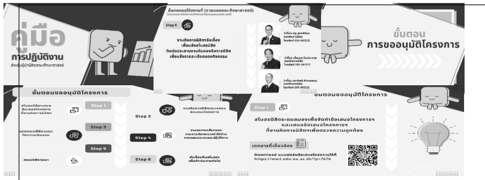
ภาพที่ 2 คู่มือการปฏิบัติงานสำหรับผู้นำนิสิตคณะศึกษาศาสตร์ มหาวิทยาลัยนเรศวร (สื่อประสม)