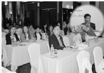
มหกรรมด้านนวัตกรรม สิ่งประดิษฐ์ งานวิจัย การ พัฒนางานประจำ ครั้งที่ 1