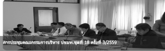
การประชุมคณะกรรมการบริหาร ปชมท. ชุดที่ 18 ครั้งที่ 3/2559