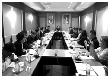
การประชุม ปชมท. สมัยสามัญ ครั้งที่ 77 (2/2559)