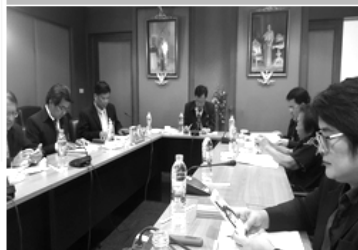
การประชุมคณะกรรมการบริหาร ปชมท. ชุดที่ 18